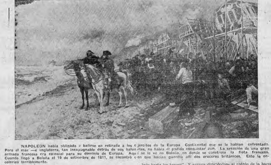
NAPOLEON había obligado a batirse en retirada a los ejércitos de la Europa Continental que se le habían enfrentado. Pero el mar — e Inglaterra, tan inexpugnable detrás de sus baluartes, no había el podido conquistar aun.

Maria Luisa también caminaba hacia el Norte aportando sus gracias al Emperador que velaba celosamente sobre ella. Maria Luisa entró en Bruselas el 22 de setiembre a la una de la madrugada, con las calles resplandecientes de luces y salutación por salvas de artillería.